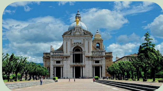
La Basilica di San Francesco

Per informazioni Segreteria Organizzativa COMUNITÀ DEL DIACONATO IN ITALIA