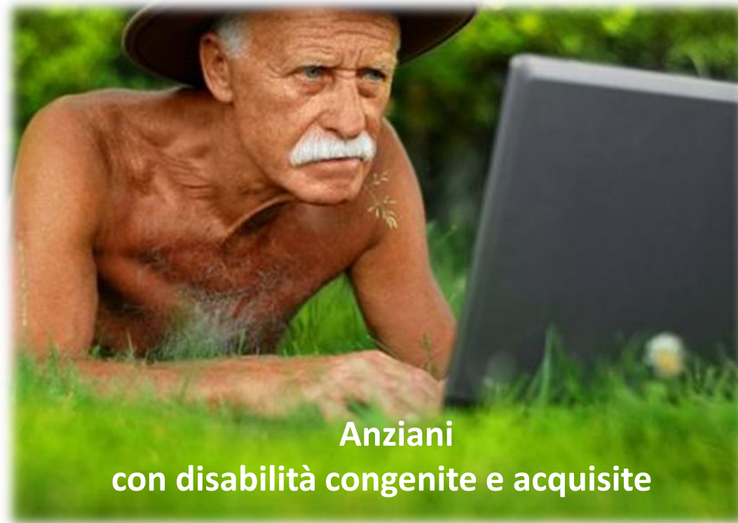
Anziani con disabilità congenite e acquisite